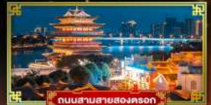
ถนนสามสายสองตรอก