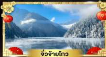
จี๋จ้ายโกว