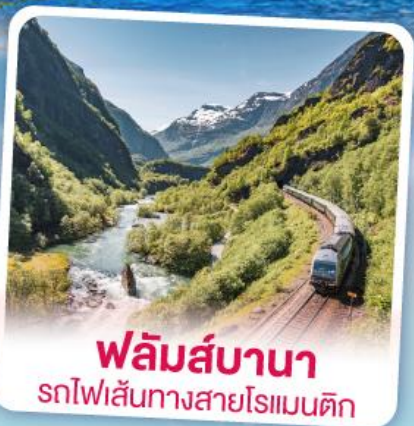
พลัมส์บานา รถไฟเส้นทางสายโรแมนติก