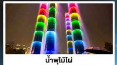
น้ำพุไม้ไฟ