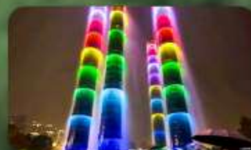
น้ำพุไม้ไฟ