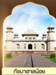
ถ้ำมาชานน้อย