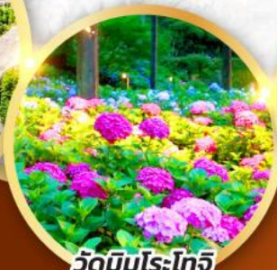
วัดมิมุโระโทจิ