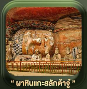
“ พาหินแคะสลักต้าจู้ ”