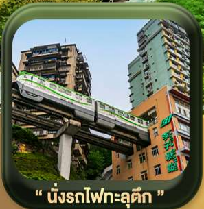
“ นั้รทไฟทะลุดัก ”

บินตรงลงจงซิง • อุ้หลง หลุมฟ้าสะพานสวรรค์ • ระเบียงแก๊ว • อุทยานเขานางฟ้า หงหยาดัง • นั้รทไฟทะลุดัก • ศาลาประชาคม (ด้านนอก) • หลงหมินฮ่าว มรดกโลกพาหินแคะสลักต้าจู้ • วัดหลิวอัน • ตักตะเกียบ • ถนนคนเดินเจียฟ้างเปย