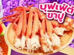
บุฟเฟ่ต์ ซาฮู