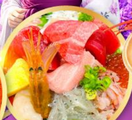
ตลาดปลาฮิมิสึ คาชิโมะอิจิ