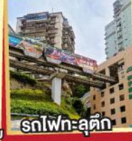
รถไฟทะลุคัง