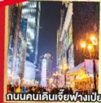
ถนนคนเดินเจียวฟางเป่ย์