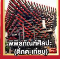
พิพิธภัณฑ์ศิลปะ (ตึกตะเกียบ)