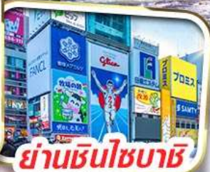
ย่านชินโซบะชิ