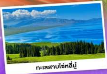
ทะเลสาบไซหลินู่

เที่ยวทุ่งหญ้าคอกฟ้า นาราถิ ชมความสวยงามทะเลสาบไซหลินู่