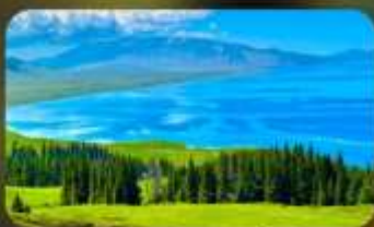
ทะเลสาบโซหลี่มู่