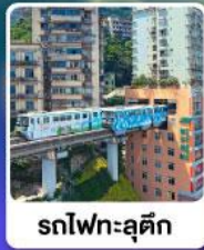
รถไฟฟ้าอัจฉริยะ