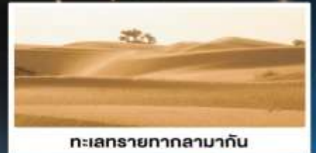
ทะเลทรายทากลามากัน