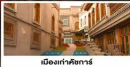
เมืองเก่าคัชการ์