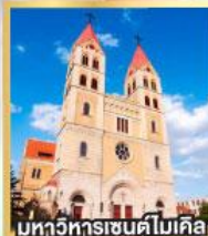
มหาวิหารเซนต์ไมเคิล