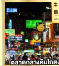
ตลาดกลางคืนโกตง