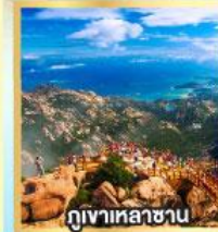
กุเขาเหลาซาน