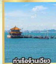
ท่าเรือจันทันเฉียว