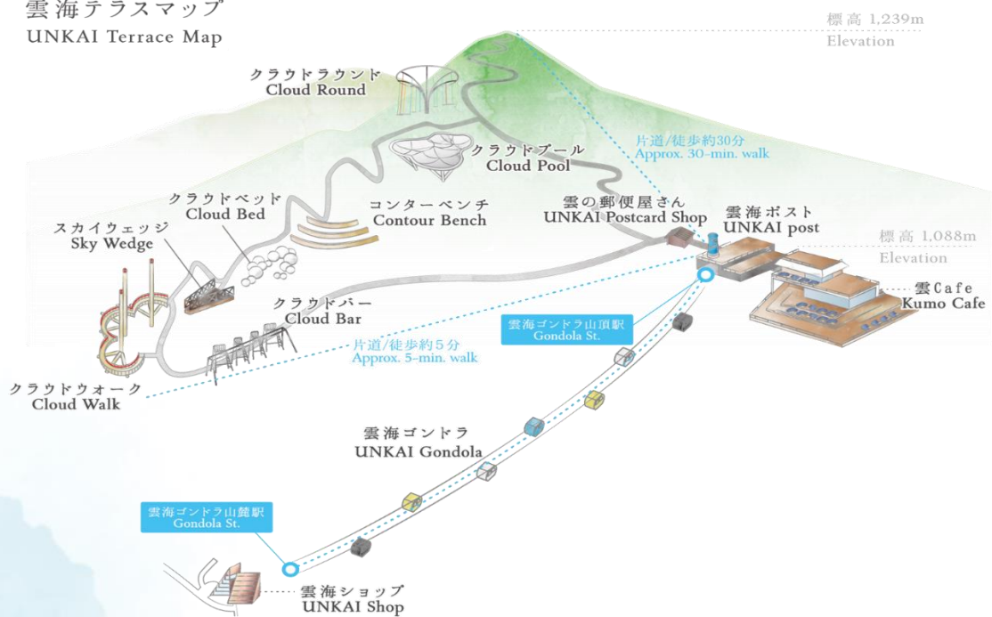
雲海テラスマップ UNKAI Terrace Map

เดินทางสู่ เมืองอาซาฮิคาว่า เป็นเมืองที่ใหญ่เป็นอันดับสองของเกาะฮอกไกโด รองจากนครซัปโปโระมีร้านค้าที่ขายข้าวและผักที่ปลูกได้ในเมือง และยังมีร้านขายอาหารทะเลตั้งอยู่มากมาย การคมนาคมสมบูรณ์แบบ ทำให้แต่ละปีมีผู้มาท่องเที่ยวกว่า 5 ล้านคนจากทั้งในและต่างประเทศ