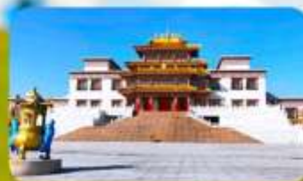
คฤหาสน์พุทธบูชาแห่งชีวีคูลาน