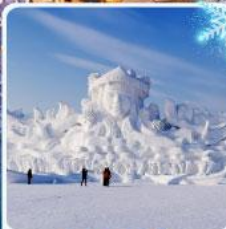
งานแกะสลัก เกาะพระอาทิตย์