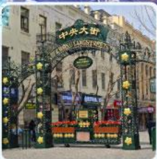
ถนนจงยาง