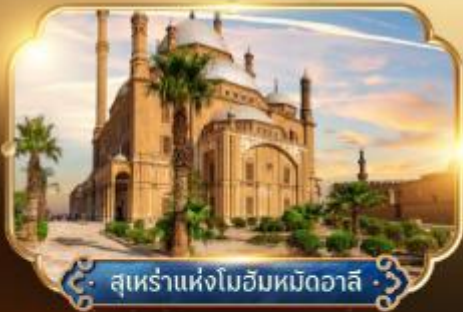
สุเหร่าแห่งโมฮัมหมัดอาลี