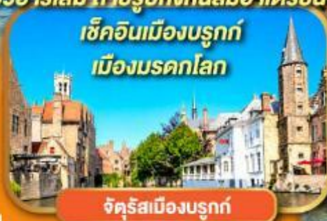
จัตุรัสเมืองบรูคจ์