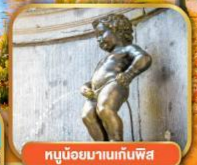
หูน้อยมานเทินพีส