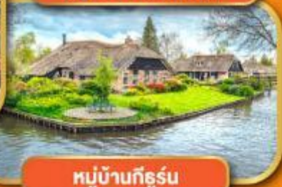
หมู่บ้านก็ธูร์น