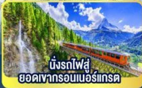
นั่งรถไฟสู่ ยอดเขารอนเนอร์เกรต