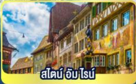
สไตน์ อัม ไนน์