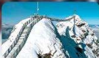
พิชิต 3 ยอดเขาตั้ง Rigi / Schilthorn / Glacier 3000