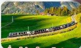
นั้รงรถไฟสายโรแมนติก 2 สาย Golden Pass / Luzern Interlaken Express