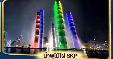
น้ำพุไม้ไฟ SKP