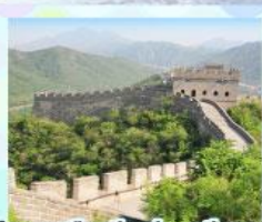
กำแพงเมืองจีน ด้านจวิยงทวน