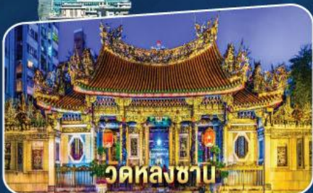
วัดหลงซา