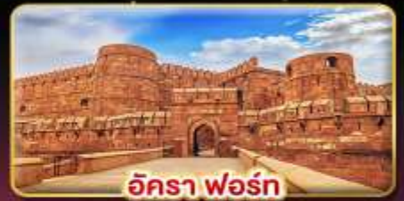
อัครา ฟอรั