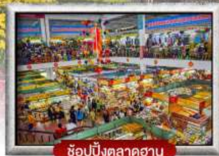
ช้อปปิ้งตลาดฮาน