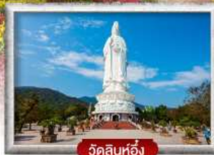
วัดลินห์ฮื่อง